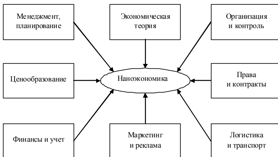
Рис. 2. Воздействие наноэкономики на теорию и практику хозяйствования