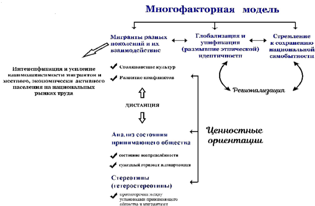
Рис. 1. Теоретическая многофункциональная модель оценки перспектив международной миграции

На этом фоне, сравнительный анализ социологических данных всероссийских исследований за период с 2013 по 2019 гг., показывает направленность взаимодействий местного сообщества с мигрантами, позволяет отметить двойственные проявления характера межгрупповых взаимоотношений. Так, среди россиян доля сторонников суждения « работа мигрантов вносит конструктивный вклад в развитие страны-приема и общества » остается стабильной – на уровне не менее 1/3 (трети) ответов (40,0 %). Вместе с тем, существенно преобладают в российской среде и две принципиально противоположные установки: с одной стороны – 2/3 участников опроса, поддерживают тезис о том, что родные и знакомые не откажутся выполнять работу, которую в данный момент выполняют иностранные граждане (64,0 %), а с другой – выделяется 63,0 % сторонников идеи « при-