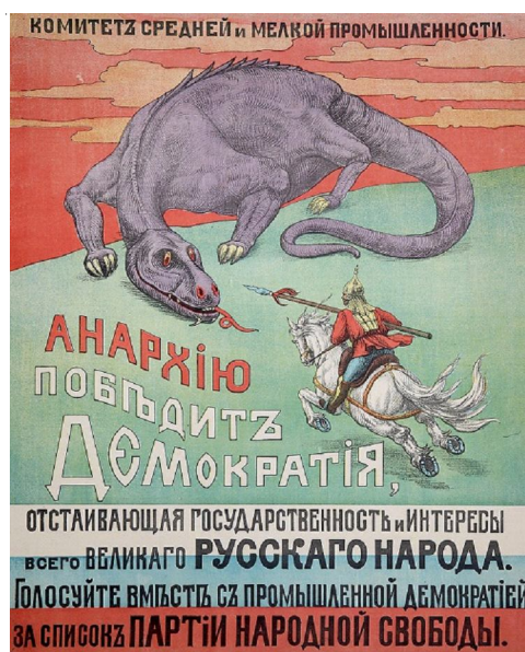
Рис. 1. Плакат «Анархию победит демократия» (Петроград, Изд-во Комитета средней и мелкой промышленности, 1917 г.)

Однако даже при наличии денег и художественных возможностей существовала проблема, что именно изображать, как донести политические идеи и какие именно идеи нужно доносить в плакате. Поиски емких и понятных символов и аллегорий не всегда венчались успехом. Попытка воспользоваться приемом символизации была сделана, например, на плакате «кадетов» «Анархию победит демократия» (рис. 1) (Петроград, Изд-во Комитета средней и мелкой промышленности, 1917 г.) или на плакате с маяком «Р.С.-ДР.П. Голосуйте за список № 1» (Петроград, Тип. «Копейка», 1917 г.).