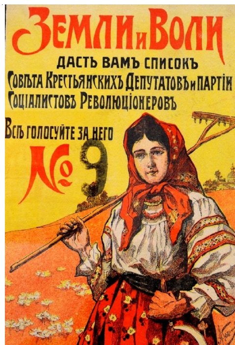
Рис. 2. Плакат «Земли и воли даст вам список Совета Крестьянских Депутатов и партии Социалистов Революционеров» (Неизвестный художник, 1917 г.)

любой другой, например на стихи о Родине или рекламу швейной фабрики. Через текст осуществляется и призыв к активным действиям – голосовать за эсеров. Текст и изображение не связаны, кроме того, текст избыточен.