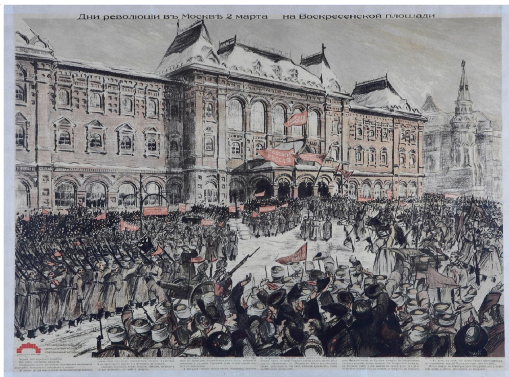
Рис. 3. Плакат «Дни революции в Москве 2 марта на Воскресенской площади» (Москва, Литогр. тов-ва И.Д. Сытина, 1917 г.)

Содержательно-коммуникативные особенности плакатов. На плакате «Дни революции в Москве 2 марта на Воскресенской площади» изображение реалистично, погружает зрителя в происходящее событие, позволяет увидеть его собственными глазами. Идея плаката «Великое освобождение России» состоит в демонстрации портретов членов Временного правительства, а также воспеании Февральской революции как освобождения России. Таким образом, идеи на обоих плакатах отражены ясно и непротиворечиво; изображения сюжетны, динамичны. Газетная реалистичность воплощается на плакатах по-разному: плакат «Дни революции в Москве 2 марта на Воскресенской площади» демонстрирует реалистичность событий, однако не использует узнаваемые образы; плакат «Великое освобождение России» демонстрирует портреты реальных людей и использует узна-