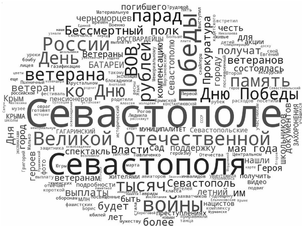
Рис. 2. Облако тегов заголовков текстов интернет-ресурсов на историческую тематику о Победе, роли Севастополя в Великой Отечественной войне