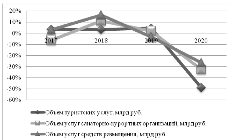
Рис. 1. Услуги населению в сфере туризма, оказанные в 2017–2020 гг., млрд руб

Примечание. Составлено по: [Платные услуги... web].