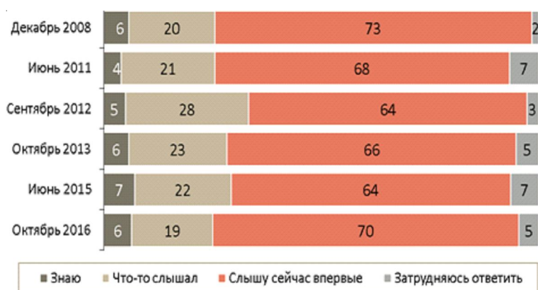
Рис. 1. Распределение ответов на вопрос «Знаете ли Вы, что-либо слышали или слышите сейчас впервые словосочетание “социальное предпринимательство”?» в опросах ЦИРКОН 2008–2016 гг., % [8]

Результаты. Респондентам задавался вопрос «Знаете ли Вы, что-либо слышали или слышите сейчас впервые словосочетание “социальное предпринимательство”?». Только 6,9 % всех опрошенных утвердительно ответили, что знают и слышали о социальном предпринимательстве (табл. 1).